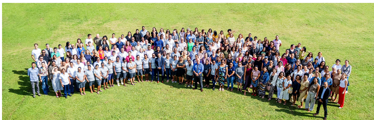
équipes en 2025/26