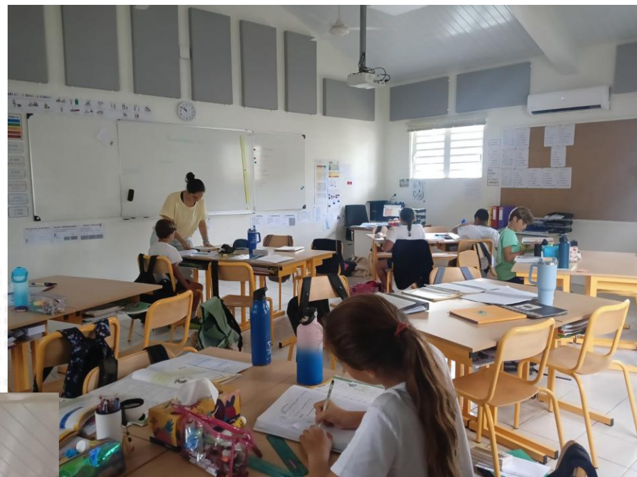
CLASSE DE CM2D