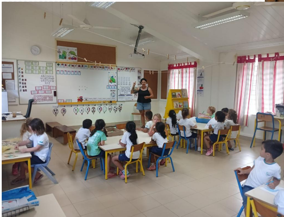
CLASSE DE MS/GS