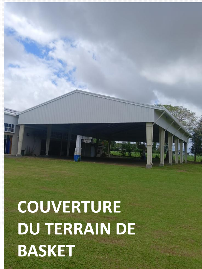
COUVERTURE DU TERRAIN DE BASKET